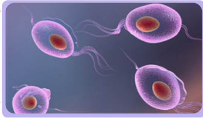
TRICOMONA VAGINALIS AL MICROSCOPIO

La infección es asintomática en al menos un 50% de las mujeres y un 70-80% de los hombres. Aunque los hombres son portadores del parásito, rara vez presentan síntomas de la infección, aunque puede haber una uretritis.